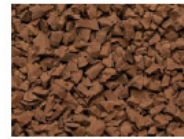
076 BEIGEBRAUN BEIGE BROWN MARRON MOYEN MARRÓN CLARO RAL 8024