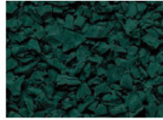
047 DUNKELGRÜN DARK GREEN VERT FONCÉ VERDE OSCURO RAL 6005