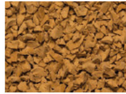
069 GELB YELLOW JAUNE AMARILLO RAL 1002