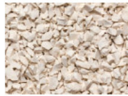
060 WEISS WHITE BLANC BLANCO RAL 9010

Los colores aquí mostrados están impresos y podrían no ajustarse al 100% al color real. Sírvase solicitar muestras físicas.