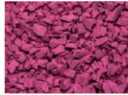
052 PINK PINK ROSE ROSA RAL 4003