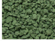
067 GRÜN GREEN VERT VERDE RAL 6021