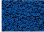
054 DUNKELBLAU DARK BLUE BLEU FONCÉ AZUL OSCURO RAL 5010