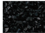
091 SCHWARZ BLACK NOIR NEGRO RAL 9004