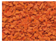
083 LEUCHTORANGE BRIGHT ORANGE ORANGE ILLUMINANT NARANJA BRILLANTE RAL 2008