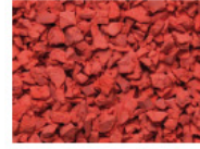
082 LEUCHTROT BRIGHT RED ROUGE ILLUMINANT ROJO BRILLANTE RAL 3017