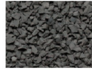
055 MITTELGRAU MIDDLE GREY GRIS MOYEN GRIS MEDIANO RAL 7037