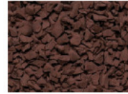
046 BRAUN BROWN MARRON MARRÓN RAL 8025