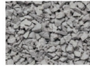
065 GRAU GREY GRIS GRIS RAL 7038