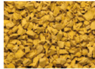
089 LEUCHTGELB BRIGHT YELLOW JAUNE ILLUMINANT AMARILLO BRILLANTE RAL 1012