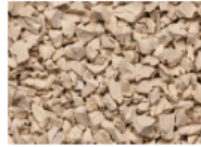
056 EGGSHELL EGGSHELL COQUILLE D'OEUF CÁSCARA DE HUEVO RAL 1015