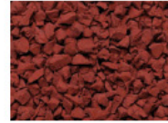
062 ROT RED ROUGE ROJO RAL 3016