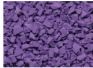
044 LILA LILAC LILAS LILA RAL 4005