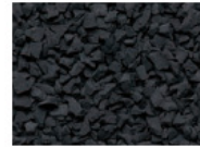
045 DUNKELGRAU DARK GREY GRIS FONCÉ GRIS OSCURO RAL 7011