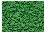
087 LEUCHTGRÜN BRIGHT GREEN VERT ILLUMINANT VERDE BRILLANTE RAL 6017