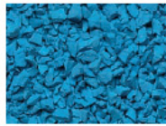
084 LEUCHTBLAU BRIGHT BLUE BLEU ILLUMINANT AZUL BRILLANTE RAL 5012