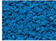
064 BLAU BLUE BLEU AZUL RAL 5015