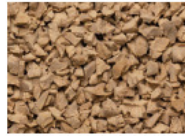
066 BEIGE BEIGE BEIGE BEIGE RAL 1014